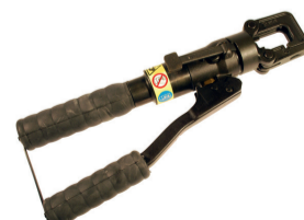
Herramientas de engaste