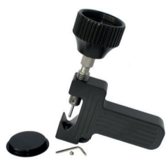
Extractor de clavijas para conexión tipo cardán