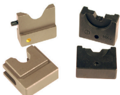
Matrices de engaste