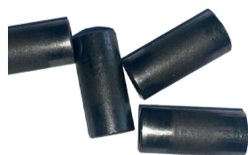
Conexión recta de acero